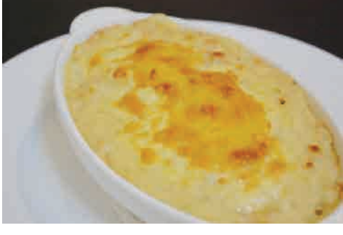
海老マカロニグラタン 価格: 150,000 VND