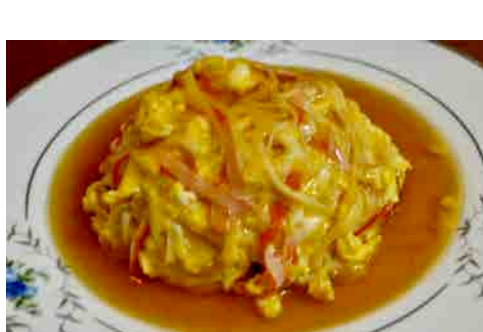
天津チャーハン 価格: 150,000 VND