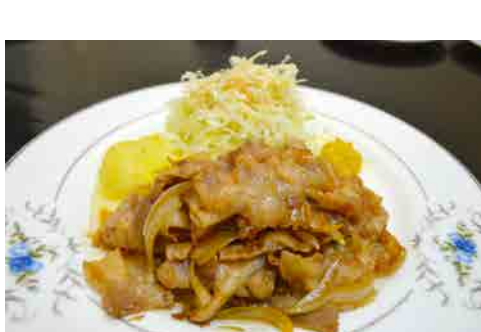
豚バラ生姜焼き 価格: 110,000 VND