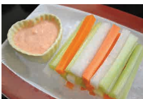
野菜スティック 価格: 80,000 VND