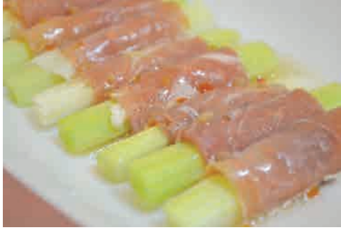
生ハム&セロリ 価格: 170,000 VND