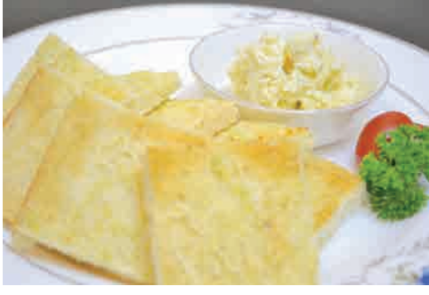
ガーリックトースト 価格: 110,000 VND