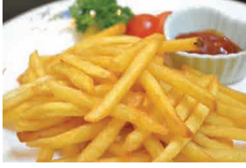
フライドポテト 価格: 80,000 VND