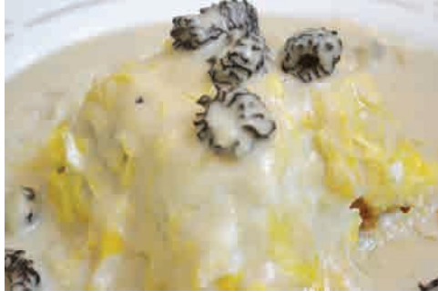
ボルチーニ茸のオムライス 価格: 220,000 VND