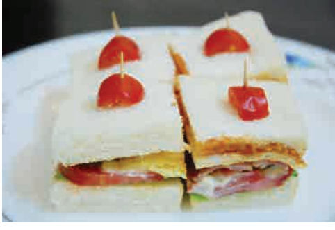
アメリカンクラブハウスサンド 価格: 150,000 VND