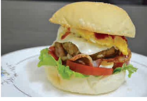
具沢山ハンバーガー 価格: 170,000 VND