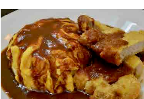
ローズカツ・オムライス・デミグラス ソース 価格: 220,000 VND