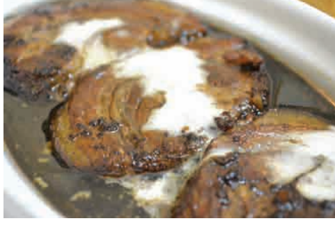
豚の和風赤ワイン煮込み 価格: 190,000 VND