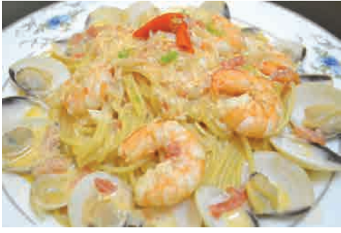
アサリと海老のトマトクリーム 価格: 220,000 VND