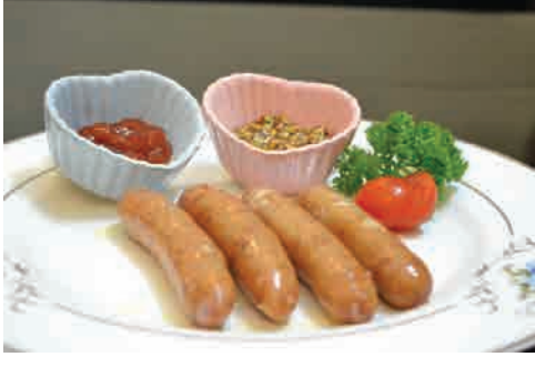
ウインナーソーセージ 価格: 60,000 VND