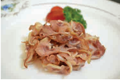
豚軟骨スモーク 価格: 110,000 VND