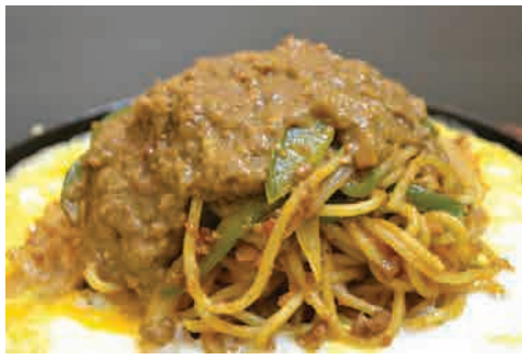
鉄板インディアンパスタ 価格: 190,000 VND