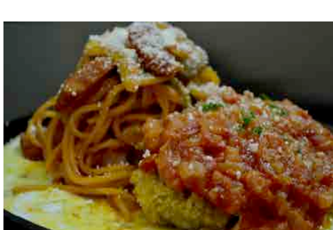
チーズチキンカツ・トマトソース& ナポリタン 価格: 200,000 VND