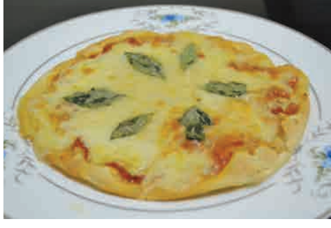
マルゲリータ 価格: 110,000 VND