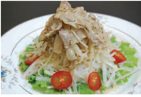
豚の温しゃぶサラダ 価格: 150,000 VND