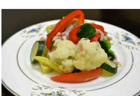
ヘルシーボイル野菜盛 価格: 115,000 VND