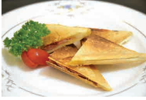
ベーコンとチーズのホットサンド 価格: 80,000 VND