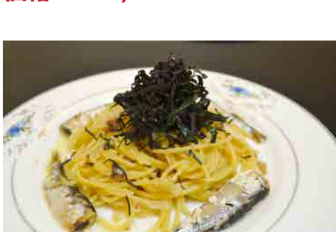
オイルサーディンのペペロンチーノ 価格: 190,000 VND