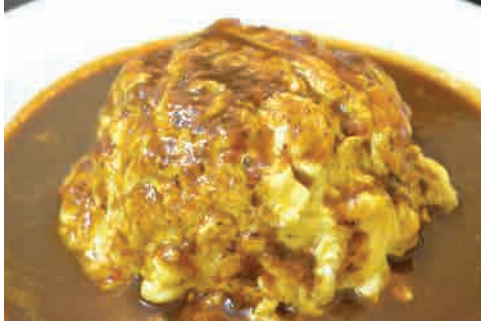
オムライス デミグラスソース 価格: 190,000 VND