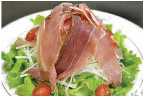
生ハムサラダ 価格: 220,000 VND