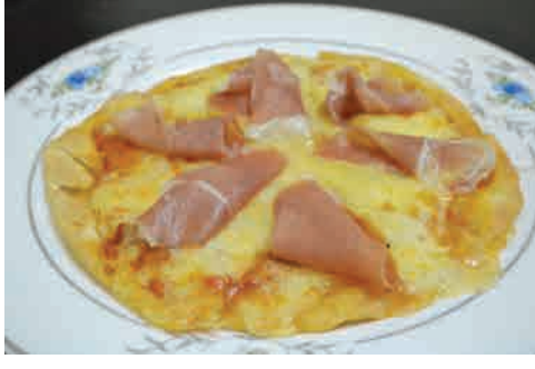
生ハムのマルゲリー 価格: 220,000 VND