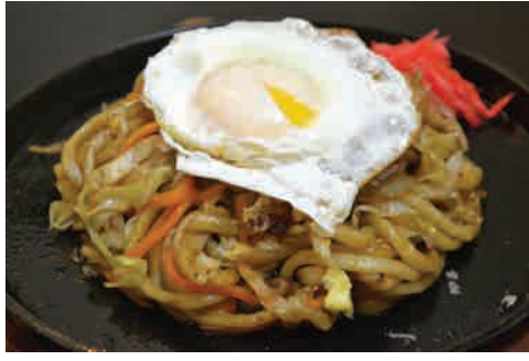
焼うどん 価格: 130,000 VND