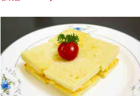
玉子いっぱいサンド 価格: 110,000 VND