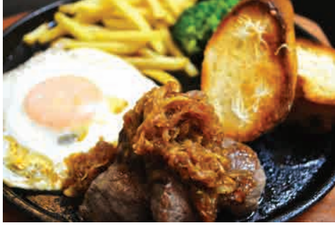
和風一口ステーキプレート 価格: 260,000 VND