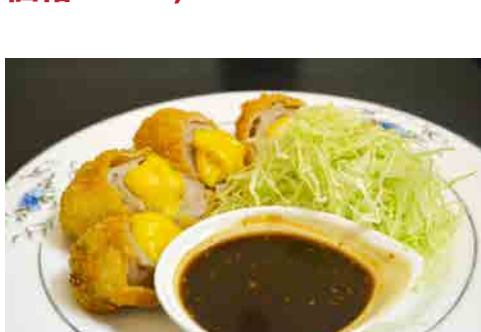
豚バラチーズ味噌カツ 価格: 110,000 VND