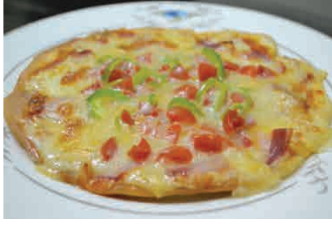
トマトとベーコンとパブリカのピザ 価格: 130,000 VND