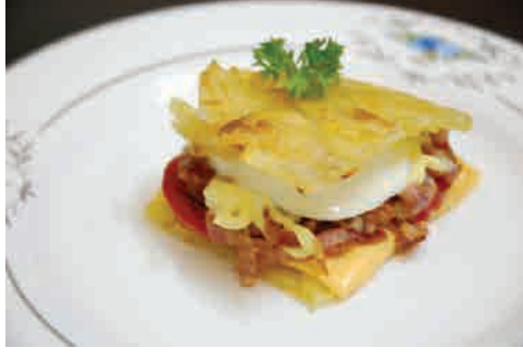
具沢山ジャガイモのガレット 価格: 130,000 VND