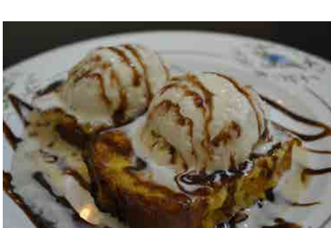
フレンチトースト 価格: 84,000 VND