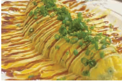
トンパイ焼き 価格: 110,000 VND