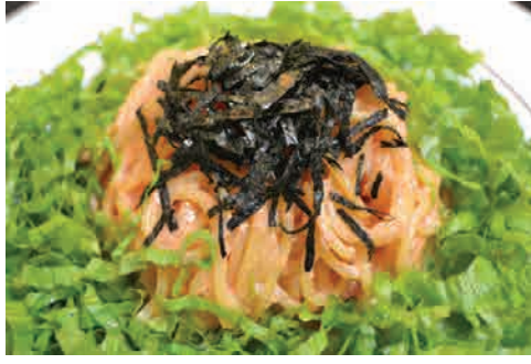
明太子とレタスのパスタ 価格: 190,000 VND