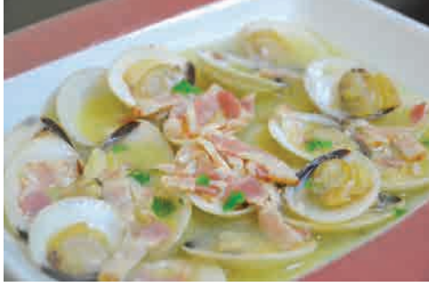
浅利の洋風酒蒸し 価格: 110,000 VND