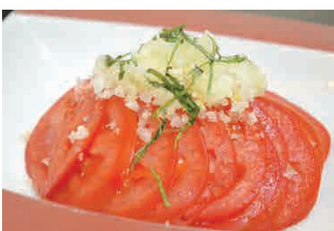
トマトサラダ 価格: 80,000 VND