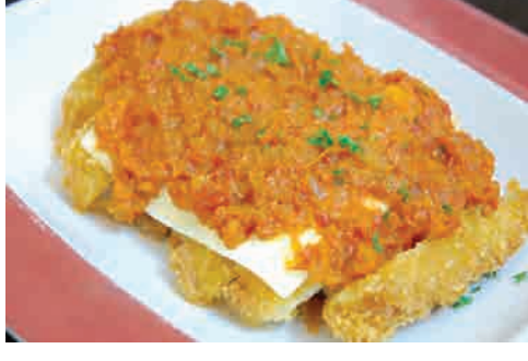
チーズチキンカツ トマトソース 価格: 110,000 VND