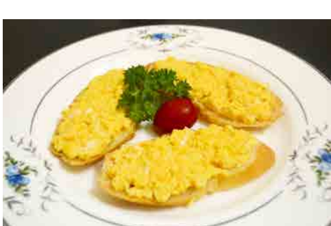
スクランブルエッグのカナッペ 価格: 80,000 VND