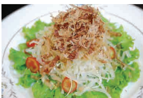
大根とベーコンのサラダ 価格: 110,000 VND