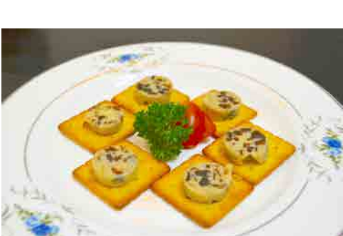
自家製レーズンバター 価格: 130,000 VND