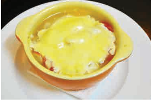
トマトスープ餃子 価格: 80,000 VND