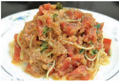
ツナとトマトの冷製パスタ 価格: 170,000 VND