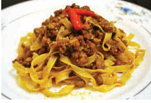
ボロネーゼパスタ 価格: 170,000 VND