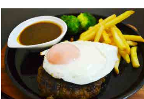
鉄板ビーフハンバーグ 価格: 300,000 VND