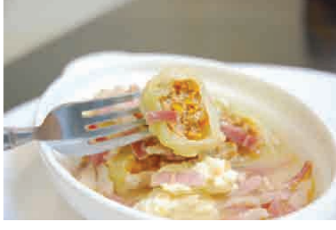
ロールキャベツ 価格: 80,000 VND