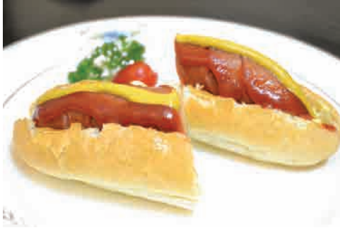
ホットドッグ 価格: 110,000 VND