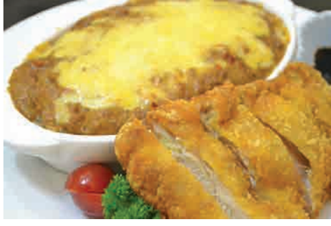
チキンカツ焼きカレー 価格: 190,000 VND