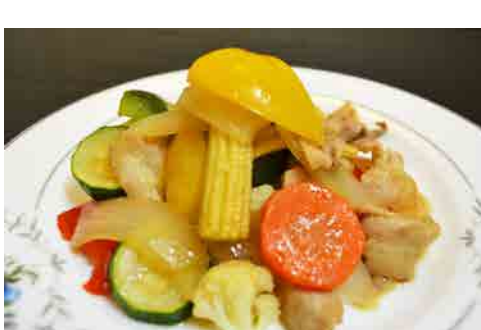
7種類の彩り野菜炒め 価格: 100,000 VND