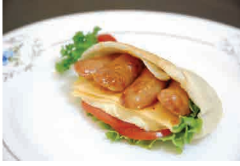
ソーセージのピタパン 価格: 60,000 VND