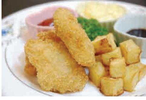
フィッシュ&チップス 価格: 110,000 VND