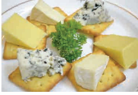
チーズの盛り合わせ 価格: 190,000 VND