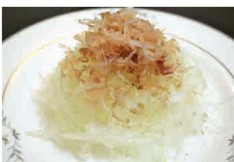
玉葱サラダ 価格: 63,000 VND