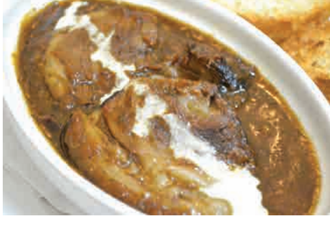
ビーフシチュー 価格: 260,000 VND