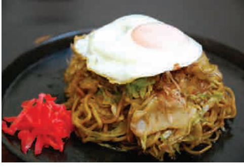
鉄板焼きそば目玉焼きのせ 価格: 130,000 VND