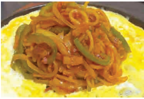
鉄板ナポリタン 価格: 170,000 VND