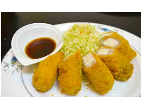
長芋の肉巻きフライ 価格: 80,000 VND