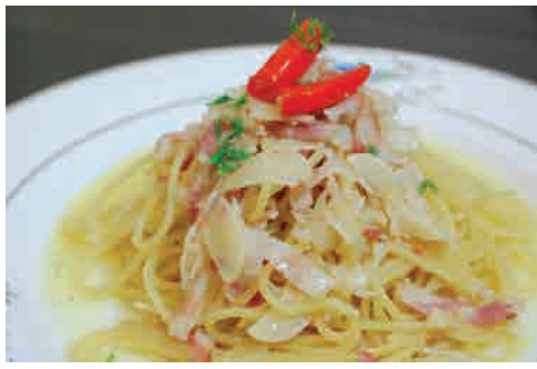
ペペロンチーノ 価格: 150,000 VND