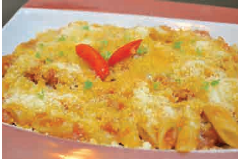
ペンネアラビアータ 価格: 150,000 VND