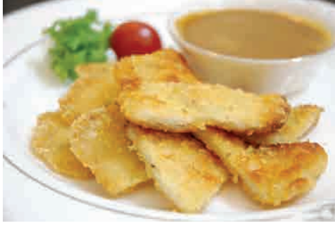
鶏せんべい 価格: 110,000 VND