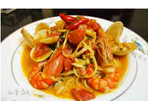
大ハマグリと海老のトマトクリーム パスタ 価格: 240,000 VND