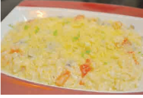
エビとキノコのトマトクリームリゾット 価格: 190,000 VND