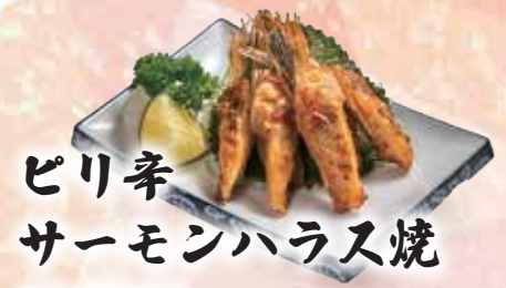
ピリ辛 サーモンハラス焼 80,000đ

Charcoal roasted salmon head Đầu cá hồi nướng 숯불 연어 머리 구이