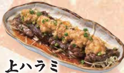
上ハラミ みぞれポン酢 160,000đ

Stir fried chicken's hearts in garlic batter soysauce Tim gà cháy tỏi 마늘 버터간장 염통 볶음