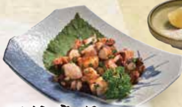
ピリ辛タコの 炭火焼 80,000đ

Charcoal roasted spicy octopus Bạch tuộc nướng than 매운 문어 구이