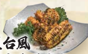
屋台風 焼きもろこし 30,000đ

Grilled ray fin with mayonnaise Khô cá đuối nướng 가오리 지느러미포