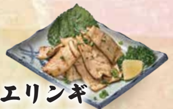
エリンギ 丸ごと焼 50,000đ

Grilled corn Japanese street style Bắp nướng sốt bơ đậm đà 포장마차식 옥수수 구이