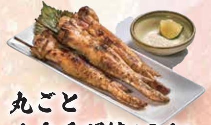
丸ごと 1本手羽焼(3本) 88,000đ

Beef skirt steak with Japanese Ponzu sauce Thăn bò sốt Ponzu 폰즈 소스를 곁들인 안창살 구이