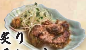
炙り チャーシュー 80,000đ

Spicy grilled salmon belly Vây cá hồi nướng cay 매운 연어 배살 구이