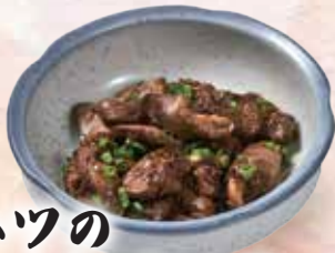
ハツの にんにくバター醤油 60,000đ

Broiled Premium big Eel 1 whole Lươn Nhật nướng (nguyên con) 장어구이 (1마리)