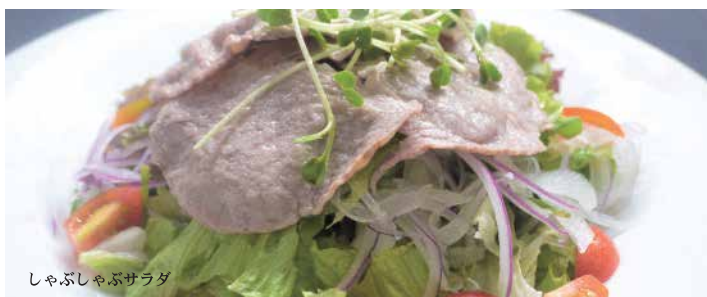
しゃぶしゃぶサラダ