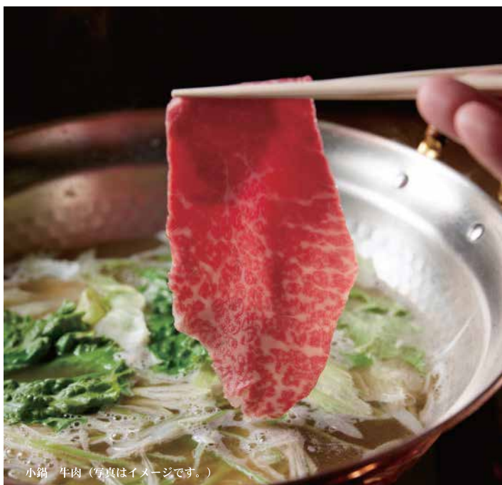
小鍋 牛肉 (写真はイメージです。)