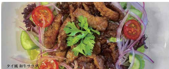
タイ風 和牛サラダ