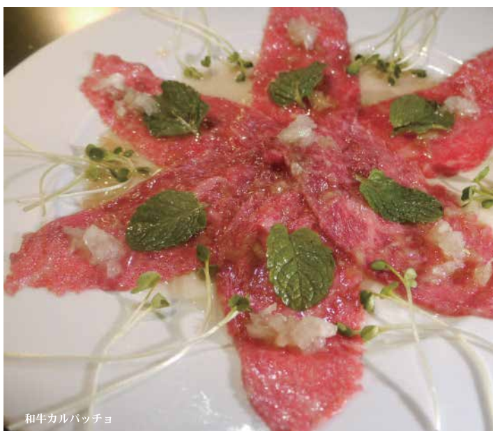
和牛カルパッチョ