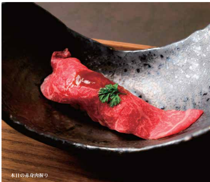
本日の赤身肉握り

小鍋 180,000VND (ブリ鍋 または 牛肉鍋) Lẩu Mini (Bò Wagyu hoặc Cá Cam)