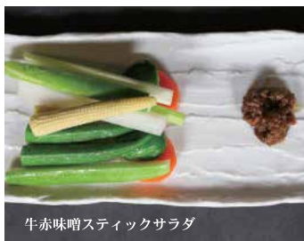
牛赤味噌スティックサラダ