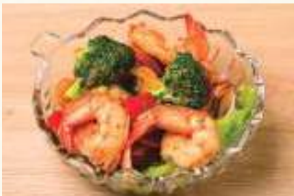
ブロッコリーと海老の バターソテー Prawn and Broccoli Butter Saute Tôm xào bông cải xanh ..... 98