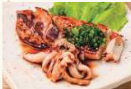
イカの照り焼き Grilled Squid Teriyaki Mực nướng sốt teriyaki ..... 98