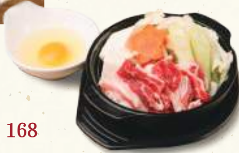
すき焼き小鍋 Small Pot Sukiyaki Lẩu sukiyaki (nhỏ) 168