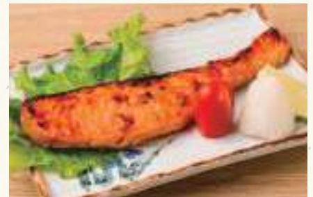
サーモンみそ漬け焼き Grilled Salmon Marinated with Miso Cá hồi tẩm miso nướng ..... 128