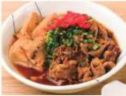
牛肉豆腐 Simmered Meat and Tofu Thịt bò hầm đậu hủ 98