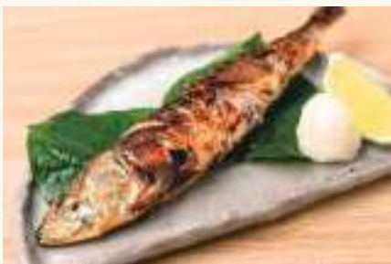
いわしの塩焼き Grilled Sardine Cá mèi nướng ..... 78