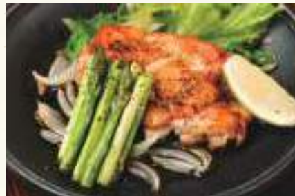
鶏モモとアスパラの鉄板焼き Grilled Chicken and Asparagus on Iron Plate ức gà xào măng tây ..... 128