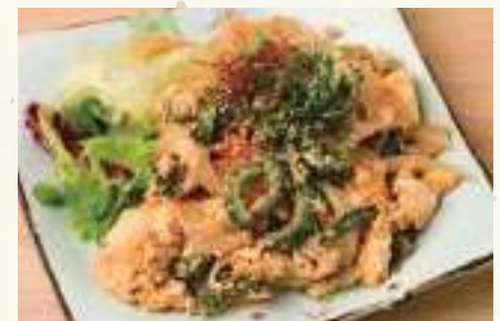
豚トロゴーヤチャンプルー Bitter Gourd with Pork Stir-Fry Thịt heo xào khổ qua ..... 108